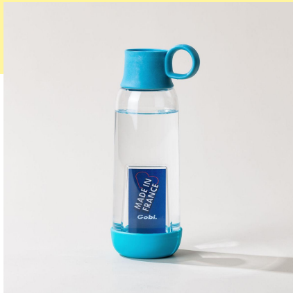
la gourde original | 46 cl la plus personnalisable

pour s'adapter à tous les quotidiens et prendre soin de ses collaborateurs