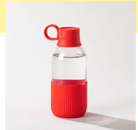
la gourde indoor | 50 cl la plus élégante en verre