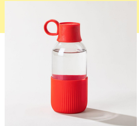
la gourde indoor | 50 cl la plus élégante en verre