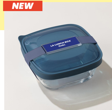
la lunch box indoor | 1,15 L en verre recyclable et 100% étanche