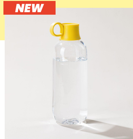
la gourde STREET | 1 L la plus grande