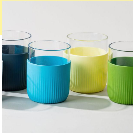
le gobelet original | 28 cl la personnalisation la plus ludique

pour déployer les essentiels du réutilisable avec une même signature design