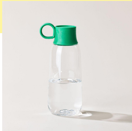
la gourde STREET | 50 cl la plus légère