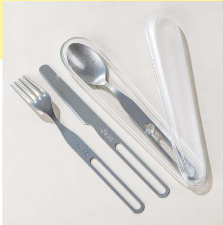
les couverts STREET aussi nomades qu'efficaces