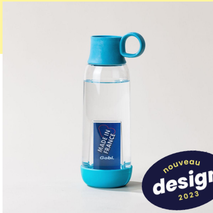
la gourde original | 46 cl la plus personnalisable

pour s'adapter à tous les quotidiens et prendre soin de ses collaborateurs